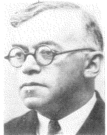
זאב ז'בוטינסקי, מאנשי המפתח של "הארץ" בשנותיו הראשונות

גם במכתב רשמי זה תבע מההסתדרות הציונית לקבל את העתון לרשותה. בימי החול — נקט לשון של שכנוע — נמכרים אלפיים עותקים, וכיום ישישי — שלושת אלפים, עקב צירוף מוסף מסחרי-כלכלי. כן הוכפל לאחרונה שטח המודעות. הגרעון, שב-1921 הגיע ל-300 לירות לחדש, ירד כדי מחצית. הוא עצמו יתפטר מתפקידו מיד לאחר תום הוועידה הציונית בקרלסבד. 22